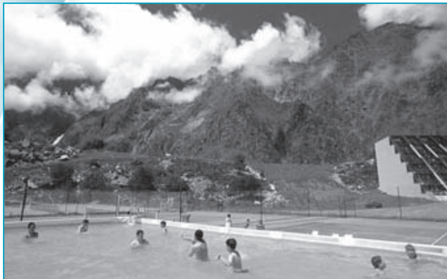
Piscine de la station