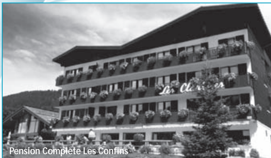
Pension Complète Les Confins