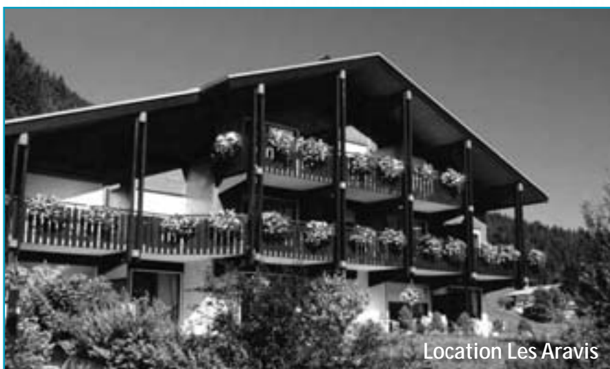
Location Les Aravis

Apéritif de bienvenue offert aux Confins, avec présentation du village, animations et excursions de la semaine. Les logements sont équipés de draps et couvertures nécessaires à votre séjour. Possibilité de location du linge de toilette. Nos amis les animaux ne sont pas admis dans nos installations.