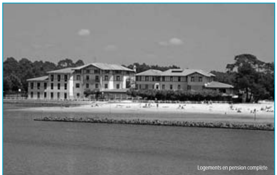
Logements en pension complète

Apéritif de bienvenue offert, avec présentation du village, animations et excursions de la semaine.