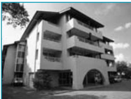
Logements en location

911 avenue du Touring Club - BP 9 40150 Hossegor Cedex Tél. 05 58 43 67 72 Fax 05 58 43 81 06 hossegor@azureva-vacances.com