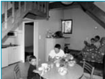
Exemple de logement en location

AZURÉVA BROMMAT EN CARLADEZ PLEAU 12600 BROMMAT Tél 05 65 66 70 00 Fax 05 65 66 08 63 brommat@azureva-vacances.com