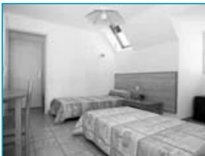
Exemple de logement en Pension Complète