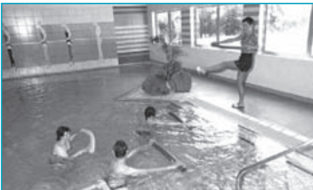
Piscine au centre Natura Fitness

Dans tous nos villages : lits et baignoires spécialement adaptés (à demander au préalable au village d'accueil), réhausseurs au restaurant.